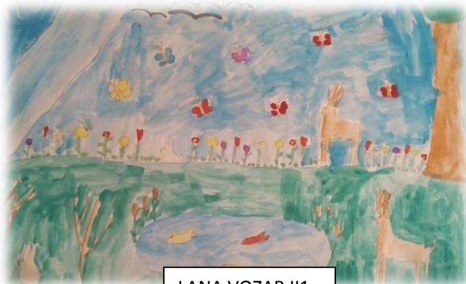
LANA VOZAR III1